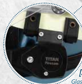
Beispiel Uni Adapter [Art.-Nr. 770208-UNI-SET]

Glasfaserverstärkter, flammhemmender Kunststoff, baumustergeprüft in Anlehnung an EN443:2008 mit den Helmen Schubert F120/F130 und Colsman AL-EX (weitere Zertifizierungen möglich)