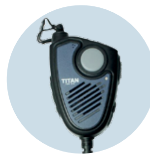
Lautsprechermikrofon MM 20