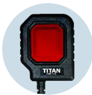
Große Sprechtaaste PTT 20