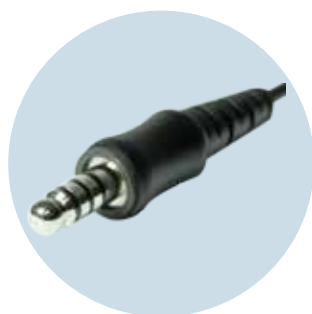
Nexus TP-120 Stecker zum Anschluss an PTT-Einheiten und Lautsprechermikrofonen